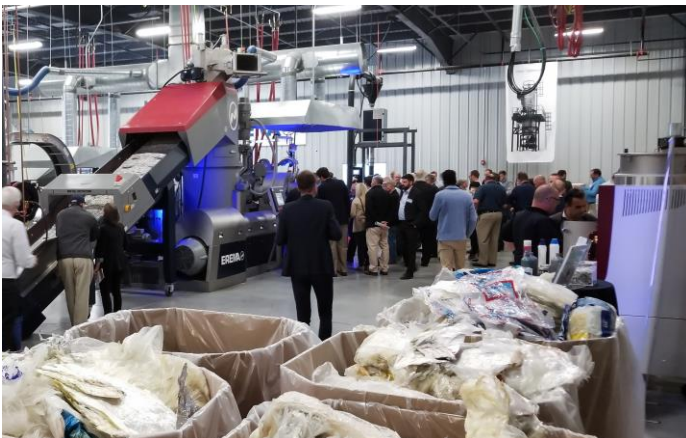
Bild 1 + 2: Während der Maschinenvorfürungen konnten die Gäste drei EREMA-Recycling Systeme im Echtbetrieb sehen.